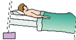
4-6 inches block